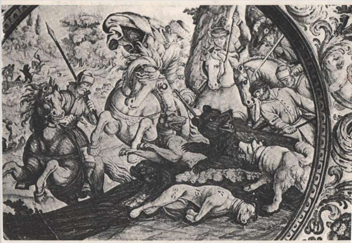
FIG 1 ANTONIO TEMPESTA 1555-1630, “CACCIA ALL’ORSO”

Sono state rilevate numerose testimonianze sulla funzione reale del mastino sia dalla viva voce dei pastori e dei massari (descrizione tipica pastorale: “massaro: uomo di fiducia e factotum del proprietario di armenti, situato al primo posto nella gerarchia pastorale. Spesso proprietario anch’esso di greggi e conduttore di aziende agricole”) che estrapolate da documenti storici e da dipinti di famosi artisti come i fratelli Palazzi.