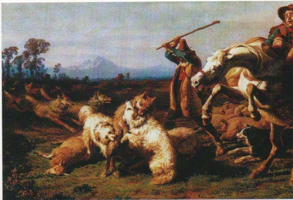
FIG. 2 FILIPPO PALIZZI 1818-1899 "CACCIA AL LUPO"