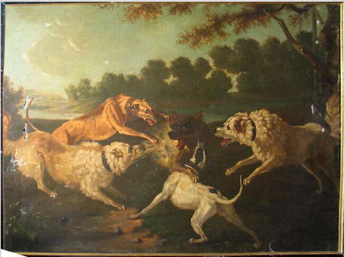
FIG. 3 OUDRY JEAN BAPTISTE, 1686-1755 “Caccia al lupo con Mastini”

“Il 5 dicembre 1818 tre lupi assalirono un gregge presso l’abitato di Villa Correlle (Amatrice). Con l’aiuto di deui cani, alcuni abitanti del luogo riuscirono a fermare e ad uccidere un lupo a colpi di accetta, bastonate e sassate ”;