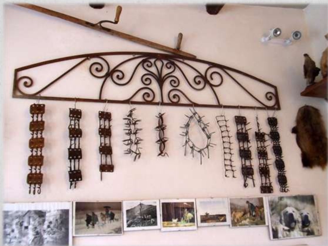
FIG 5 VRACCALI, Museo Il Contado del Molise, Centro Cinofilo Razze Meridionali

la seconda tecnica consiste nel mettere al collo dei grossi maschi adulti il "vraccale" (o "vreccale"), il tipo collare di ferro irto di punte metalliche. Nell'ambiente del mastino abruzzese indossare o meno il vraccale può davvero fare la differenza tra la vita e la morte.